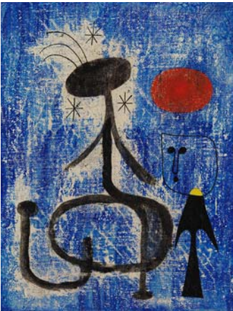
JOAN MIRÓ Montroig 1893-1983 Mallorca