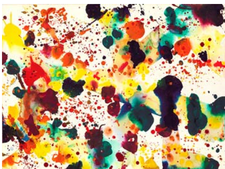
SAM FRANCIS San Mateo 1923-1994 Santa Monica