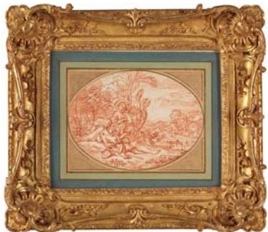
FRANÇOIS BOUCHER Paris 1703-1770 Paris

Schätzung: CHF 50'000 / 70'000 bzw. EUR 42'000 / 58'000