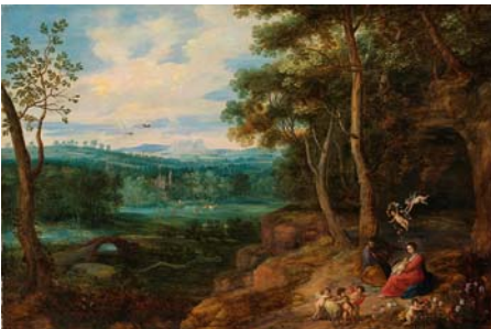
JAN BRUEGHEL II UND PIETER VAN AVONT Antwerpen 1601-1678 Antwerpen bzw. 1600-1652