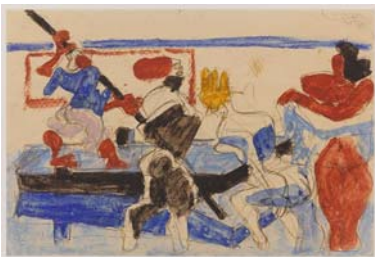
LE CORBUSIER eigentlich CHARLES-EDOUARD JEANNERET La-Chaux-de-Fonds 1887-1965 Roquebrune-Cap Martin

Schätzung: CHF 20'000 / 27'000 bzw. EUR 16'650 / 22'500