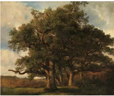
ALEXANDRE CALAME Vevey 1810-1864 Menton