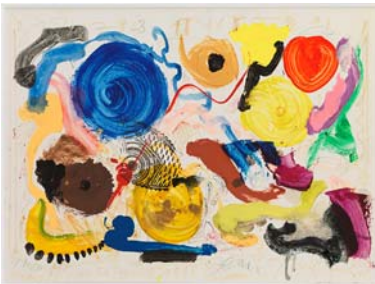
JEAN TINGUELY Fribourg 1925-1991 Bern

Provenienz: Schweizer Privatsammlung (direkt vom Künstler erworben)