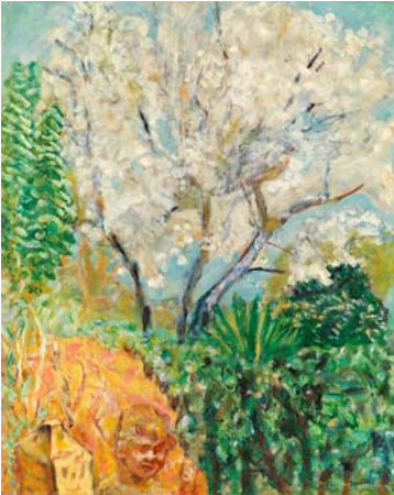
PIERRE BONNARD Fontenay-aux-Roses 1867-1947 Le Cannet