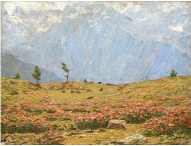
EMILIO LONGONI Mailand 1859-1932

Sommerliche Alplandschaft mit weidenden Kühen