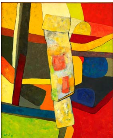
MAURICE ESTÈVE Culan 1904-2001 Culan

Provenienz: André Emmerich Gallery, New York Sotheby's, New York, Auktion vom 3. Mai 1989, Kat.-Nr. 163 Sotheby's New York, Auktion vom 20. November 1997, Kat.-Nr. 154 Nachkommen von James Johnson Sweeney (ursprünglich an oben genannter Auktion erworben) Christie's, New York, Open House, Auktion vom 10. Juli 2007, Kat.-Nr. 203 (Property from the descendants of James Johnson Sweeney) Schweizer Privatsammlung