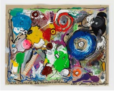
JEAN TINGUELY Fribourg 1925-1991 Bern