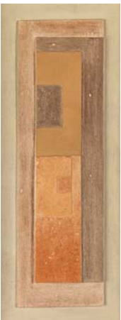
BEN NICHOLSON Denham 1894-1982 London